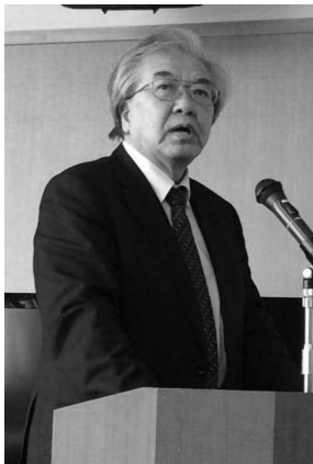
説明する間口相談員

①マンションが耐震改修の必要性の認定を受け、大規模な耐震改修を行おうとする場合の決議要件が3/4から1/2に緩和された。②対象は昭和56年5月31日以前に建築確認を受けたマンション（旧耐震基準）。特に注意が必要なマンションは一〇コの字型やL字型など（平面や断面形状が不整形）〇ピロティがある（構造上のバランスが不利）〇SRCとRCが混在（構造形式が混在）③耐震診断は、依頼→調査→診断結果の報告→継続使用or要改修となる。④相談する関係団体は、「公益社団法人北海道マンション管理組合連合会」「公益財団法人マンション管理センター」「一般財団法人日本建築防災協会」等です。北海道のお問い合わせ先は住宅局建築指導課(011-231-4111内線29-465)