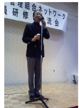
川嶋支援センター 理事長