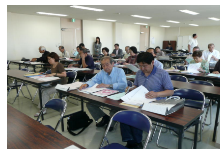
熱心に聞き入る参加者